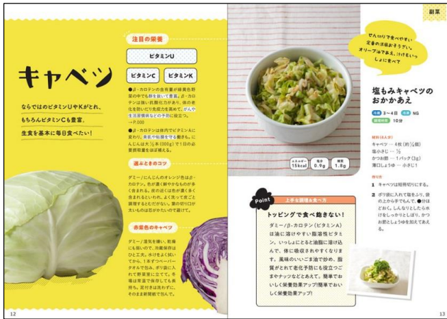
※画像は仮画像です。

いつも食べている食材の栄養をもっとおいしく、もっと効率的に摂れる、かんたん作りおきレシピを収録。食材別の栄養や調理のコツをわかりやすく紹介しています。不足しがちな野菜を中心にした副菜と肉や魚を合わせた主菜にもなる常備菜が64個掲載!