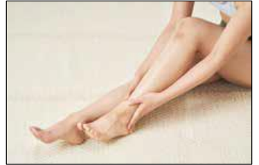
※画像はすべて仮画像になります。

アロマセラピーを始めたい方から、セラピストとして活動されている方まで、満足できる内容です。